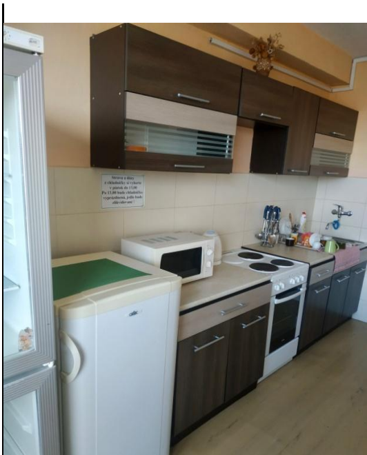
Kuchynka v ŠI