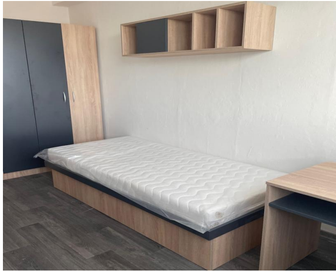
Izba v ŠI